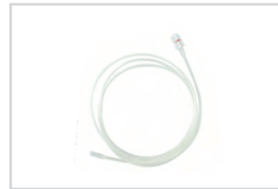
7.20.01.004 1200 PSI Uzatma Hattı 120 cm