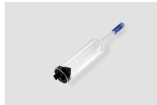
D-150-01 Steril Şırınga J Tipi Dolum Pipeti